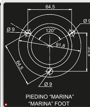
PIEDINO "MARINA" "MARINA" FOOT