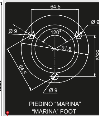
PIEDINO "MARINA" "MARINA" FOOT